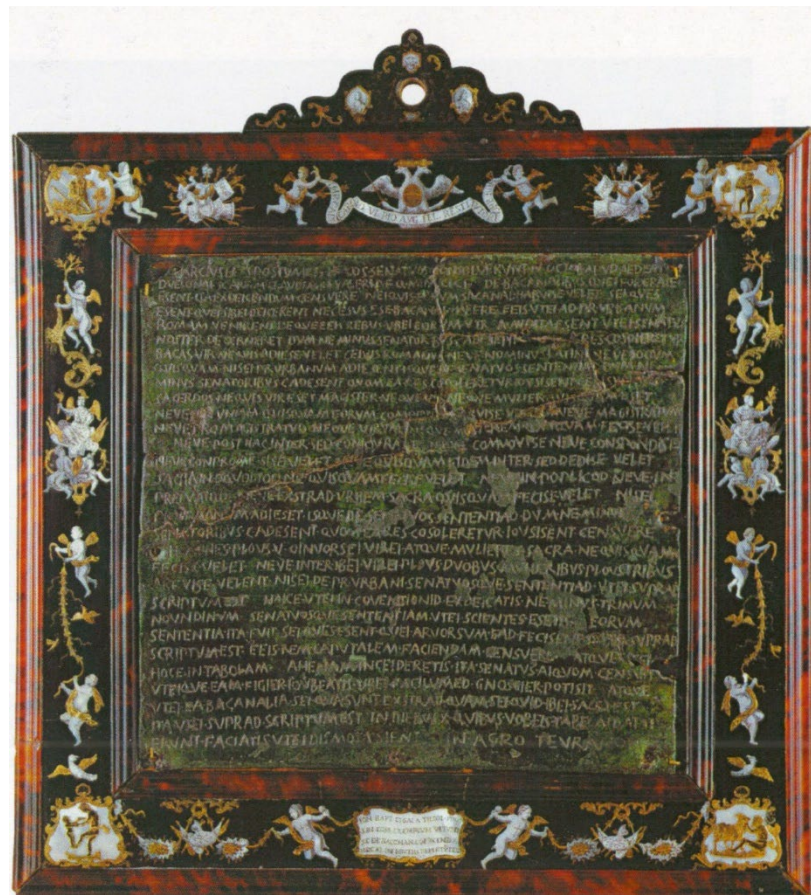
Постанова сенату про вакханалії (Senatus Consultum de Bacchanalibus). Бронза. 186 р. до н. е. Висота 27.3 см, ширина (без рамки) 28.5 см. Вена, Музей історії мистецтв.