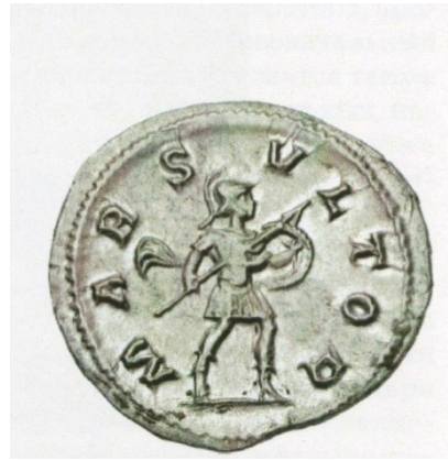
Север Александр (222–235 pp.). Денарій, Рим 231–235 pp./ MARS VLTOR Марс йде направо, тримає спис та щит.