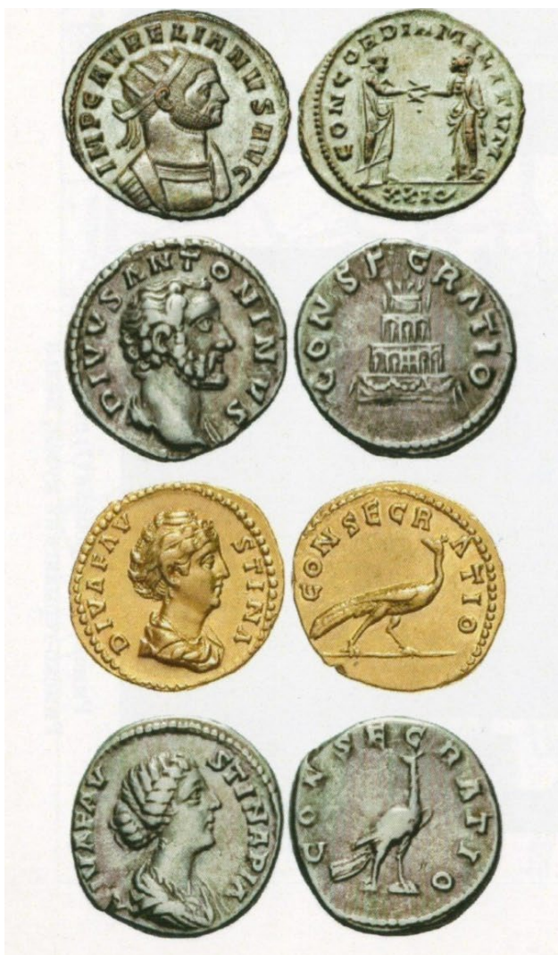
Авреліан (270–275 pp.). Антонініан. Кізик 275 р. (4.06 г, 24 мм). IMP AVRELIANVS AVG. Бюст в обладунках і лучовій короні направо.