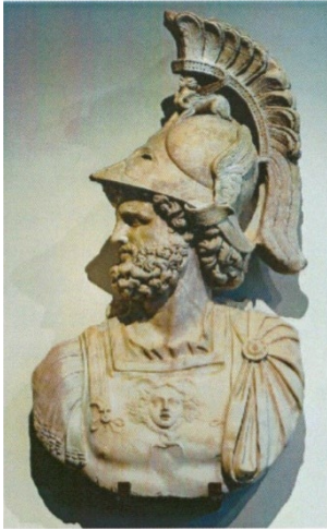
Марс. Мармуровий рельєф. Голова – II ст. н. е. Бюст – XVI ст. Рим, Національний Римський музей, Палаццо Альтеме.