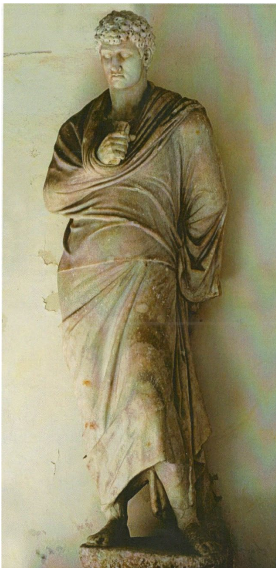
Портрет римлянина у тозі (голова – від іншої статуї). Мармур. 1-ша половина I ст. – 2-га половина II ст. н. е. Верона, Археологічний музей.