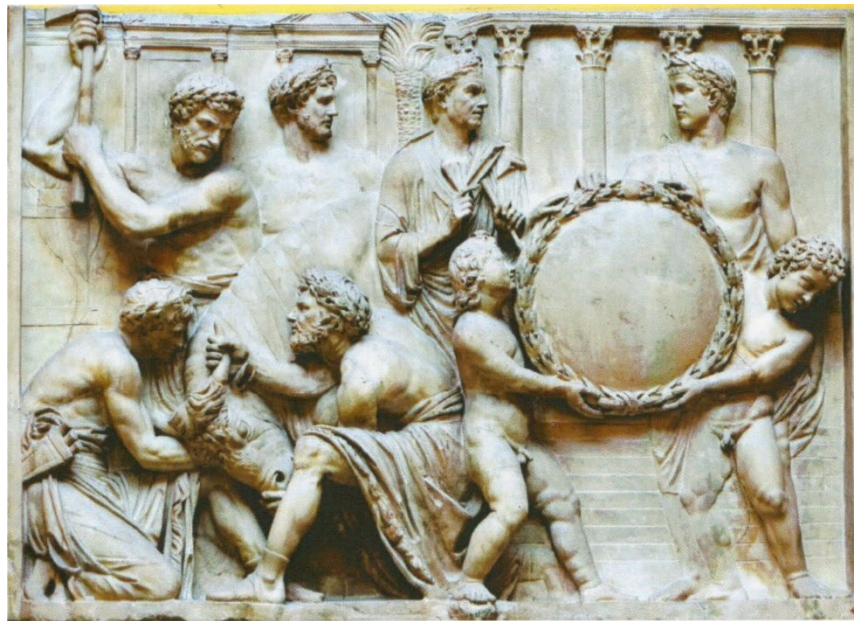
Сцена жертвопринесення. Лунський мармур. II ст. н. е. Висота 1.20 м, довжина 1.67 м. Флоренція, Галерея Уффіці.