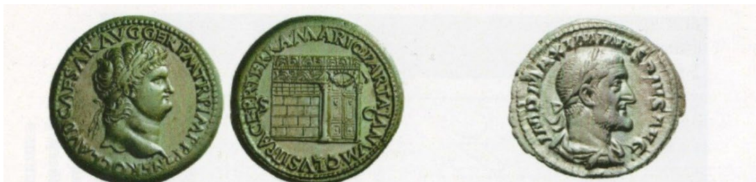
Нерон (54–68 pp.) Æ Ас, Рим 65 р., (10.51 г, 27 мм). NERO CAESAR AVG GERM IMP Увінчана голова Нерона направо/PACE PR VBIQ PARTA IANVM CLVSIT SC Храм Януса з решітчастим вікном і зачиненими дверима.